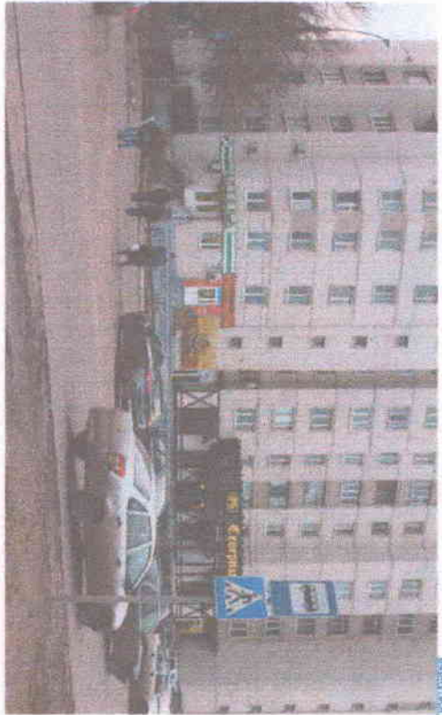
БЕЛГОВА НА ДИПЛОМАТИКА

Фото поддржане и образователни организации