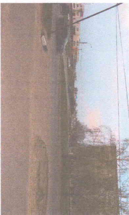
Улица Рилева видна на територија школи